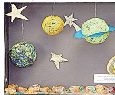
Работы участников выставки

Библиотеке № 216 открывается выставка работ детей дошкольного и младшего возраста, посвященная освоению космоса, межпланетным полетам и далеким галактикам. Выставка продолжит работу до 18 апреля.