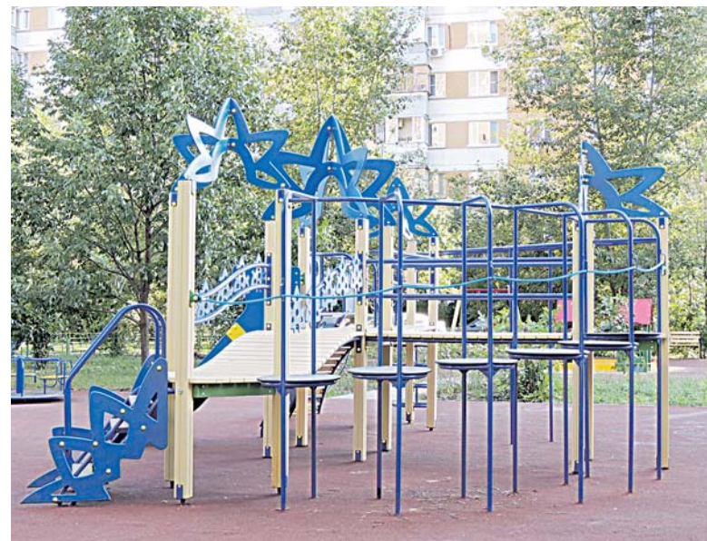
Детская площадка по адресу: Пятницкое шоссе, дом 33/1 – 33/2