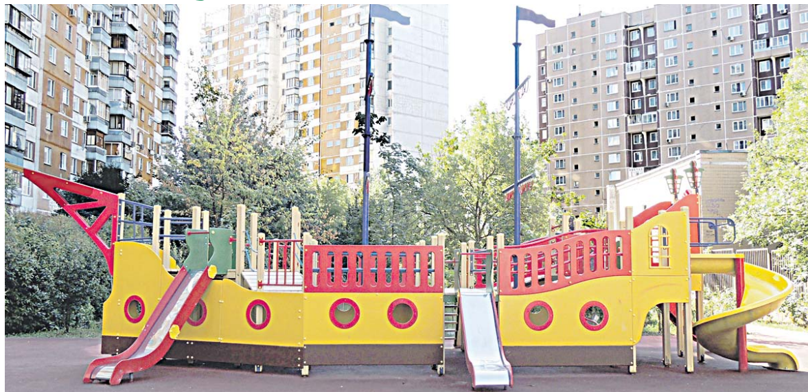
Детская площадка во дворе дома 35 по Пятницкому шоссе