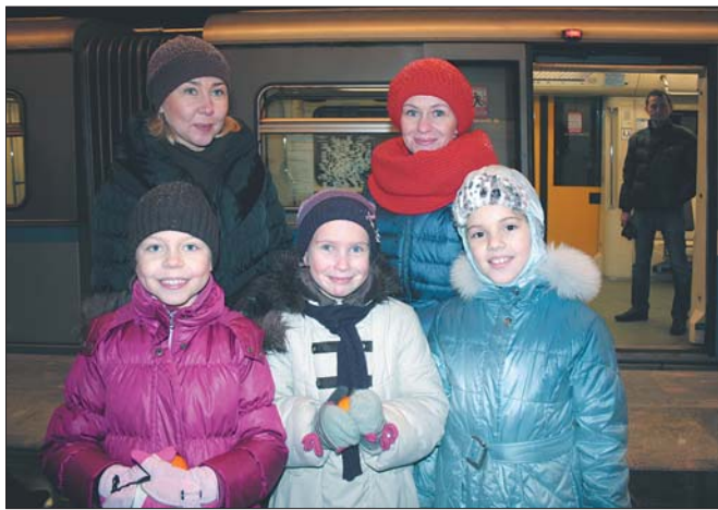
Народный коллектив «Веснушки» пригласили на открытие станции. Домой они решили поехать на метро

Станция имеет необычную форму – она не прямая, а изогнута по дуге. Это решение, хотя и добавило трудностей строителям и отделочникам, придало облику станции уникальность. Для отделки станции использовано 4 вида гранита и 2 сорта мрамора, два типа панелей, нержавеющая сталь. Стены, расположенные по внутренней дуге станции, облицованы мрамором белого цвета, а по внешней дуге – черным. Вдоль оси платформы расположены черно-белые колонны. Станция «Пятницкое шоссе» имеет два вестибюля: северный надземный расположен в районе пересечения Пятницкого шоссе с Муравской улицей, здесь есть эскалаторы. Южный вести-