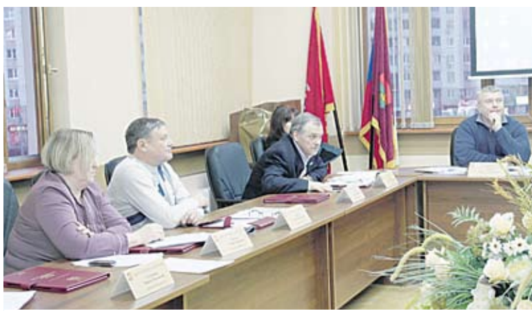
Депутаты Совета депутатов МО Митино

Главный врач еще раз напомнила о том, что пациент может