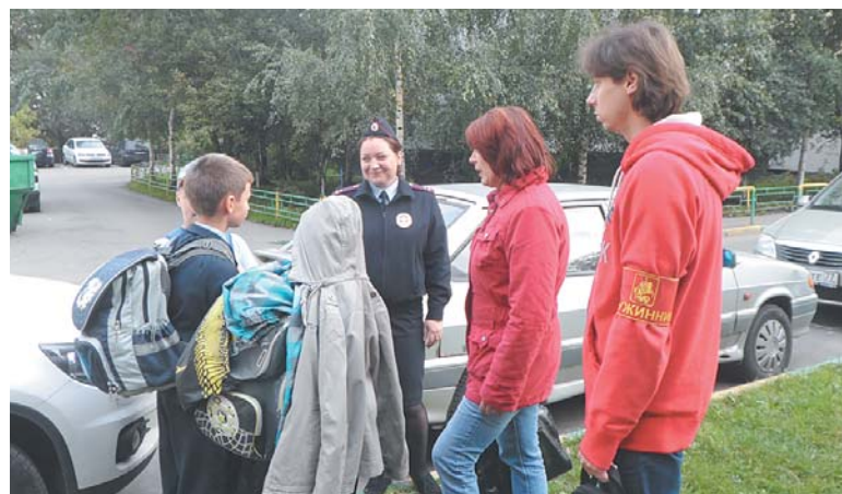
Во время рейда

вителей. Сотрудник ОДН вызвал родителей несовершеннолетнего. С ними проведена профилактическая беседа, составлен административный протокол по ст. 3.12, ч. 3 Закона г. Москвы.