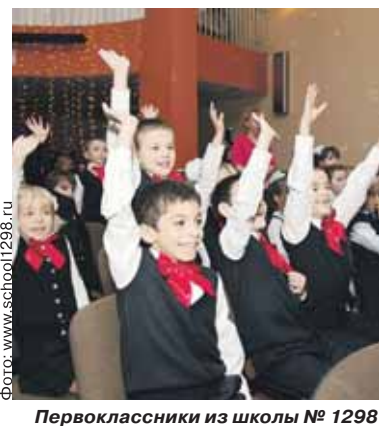
Первоклассники из школы № 1298

Родители куркинских школьников неоднократно высказывали жалобы на то, что у их детей всего один выходной день. Теперь их поддержал мэр Москвы Сергей Собянин, который выступил за возвращение московских школ к пятидневной учебной неделе.